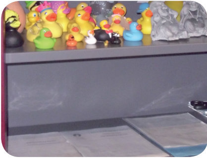
Kast in het politielokaal op de jeugdrechtbank: dossiers... en speelgoed.

Op 10 maart werd het rapport over het verkennd onderzoek op de jeugdrechtbank van Antwerpen overhandigd aan de opdrachtgevers en in hun aanwezigheid voorgesteld aan de belangstellenden van de jeugdrechtbank.