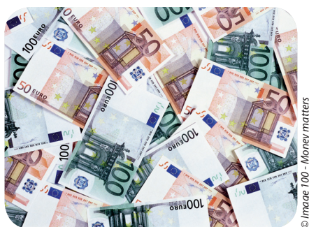
Money matters