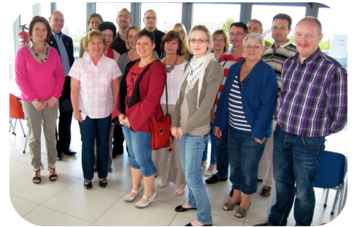
Het projectteam van het Arbeidsauditoraat van Charleroi

Naar aanleiding van het rapport met betrekking tot de interne dialoog als verbeteringsfactor, dat door de commissie in februari is gepubliceerd, heeft het arbeidsauditoraat te Charleroi